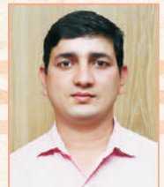
ಬಿ. ಬಹದ್ದೂರ್ ಬದಾಯತ್ ಭದ್ರತಾ ರಕ್ಷಕರು