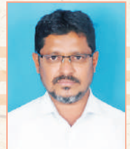
ಎನ್. ಅಚ್ಚರ್ ಅಲ ವಾಹನ ಚಾಲಕರು