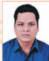
ಗಣೇಶ್ ಭದ್ರತಾ ರಕ್ಷಕರು