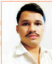
ಲಕ್ಷ್ಮಣ್ ಭದ್ರತಾ ರಕ್ಷಕರು