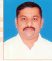
ಜಿ.ಪಿ. ಜೀವನ್ ವ್ಯವಸ್ಥಾಪಕರು